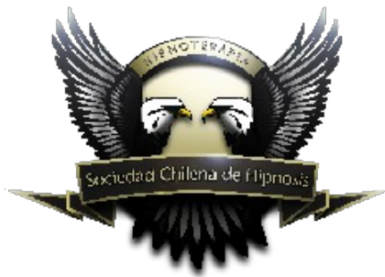
Sociedad Chilena de Hipnoterapia (Hipnomédica)