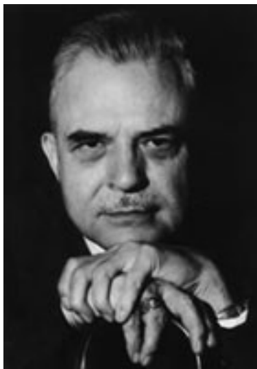
Dr. Milton Erikson (1901-1980)

“¿Por Qué Un Psiquiatra Pasó Su Vida Entera Aprendiendo A Hipnotizar A La Gente Sin Que Ellos Se Dieran Cuenta...Usando Una Conversación Normal Con Fines Hipnóticos?”