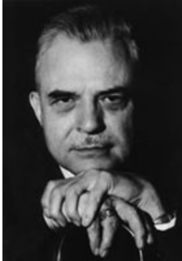
Dr. Milton Erikson (1901-1980)