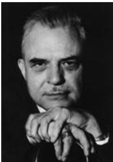
Dr. Milton Erikson (1901-1980)