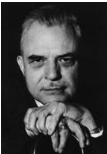
Dr. Milton Erikson (1901-1980)